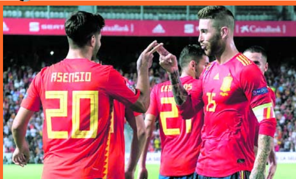
Aplastante victoria de España contra Croacia

Una aplastante victoria por 6-0 abrazó España enfrentando a Croacia en su segunda participación de la Liga de Naciones. Fue