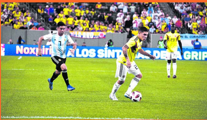
No hubo goles entre Colombia y Argentina.

Con un empate sin goles ante Argentina que mostró distintas historias en cada tiempo del juego, nuestra Selección Colombia culminó un interesante doblete amistoso post Mundial, disputado en territorio norteamericano. A la victoria 2-1 ante Venezuela la semana pasada, se le suma esta paridad que mostró aspectos atractivos, caras nuevas, foguero para los no habituales titulares, atisbos de distintos planes tácticos, varios detalles para corregir y un balance positivo.