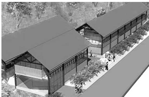
El centro estará en la carrera 56 con calle 7 oeste.

En los cinco primeros pisos del Palacio, quedarían funcionando los juzgados de la jurisdicción penal, debido a la gran afluencia de trámites y detenidos que llegan cada día,