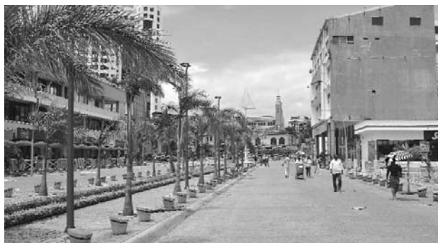
Buenaventura es uno de los municipios que accedió a los créditos de los bonos de agua.

Barreras afirmó que "si bien los créditos permitieron realizar obras de acueducto y saneamiento básico, las tasas