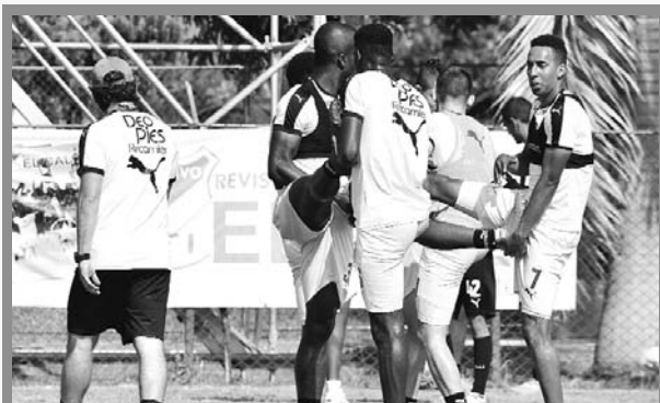
Sumar es la premisa azucarera en el Atanasio.

El domingo 14 de octubre a las 17:15 en el estadio Atanasio Girardot, Deportivo Cali visitará a Atlético Nacional en un duelo válido por la 14 de la Liga Águila II.