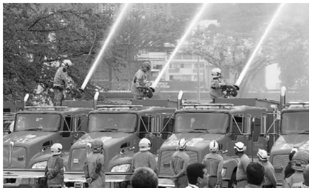
Cuerpo de Bomberos de Cali en exhibición.

Soldados y Policías también lo hacen, son nuestros héroes y necesitan contar con más apoyo, con la dotación, la infraestructura y condiciones dignas para trabajar", aseguró Villamizar.