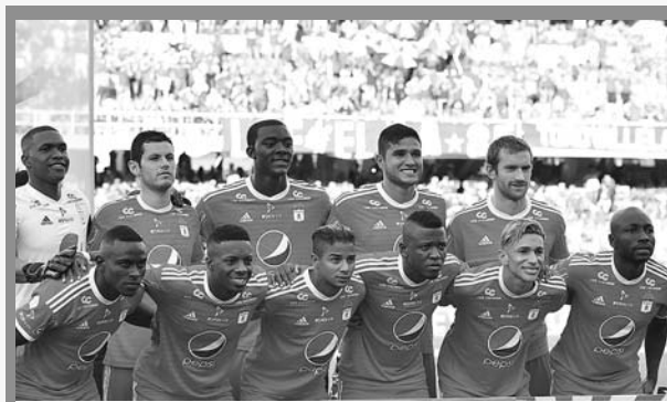
América solo piensa en la victoria contra el DIM