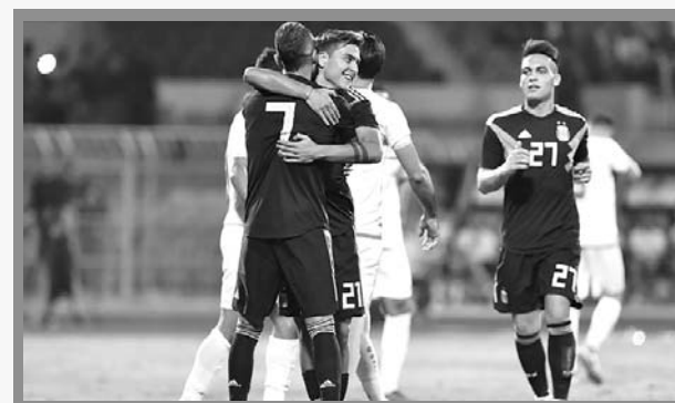
Argentina enfrenta a Brasil el próximo martes.

Luego del triunfo 4-0 ante su similar de Irak, la Selección Argentina apunta sus cañones hacia el histórico compromiso ante Brasil, que se disputará el próximo martes 16 de octubre en el Estadio King Abdullah Sports City, ubicado en Yeda, Arabia Saudita.