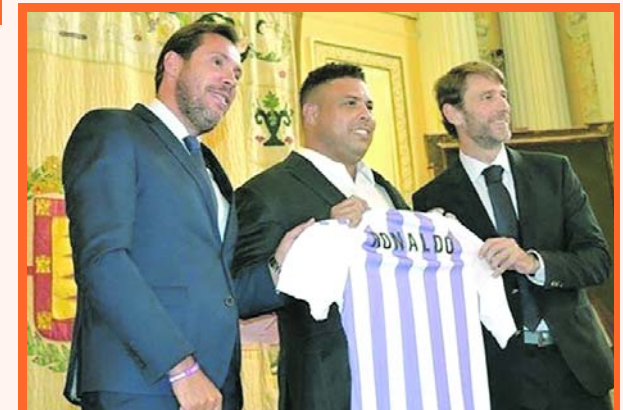
Ronaldo Nazario, listo para su nuevo reto.

A finales del presente mes, en una reunión con todos los integrantes de la Junta Directiva del club, El Real Valladolid español formalizará la presidencia del brasileño Ronaldo Nazario. Esto gracias a que el Consejo Superior de Deportes, aprobó la compra del 51% de las acciones por parte del astro brasileño.