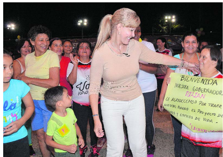
Los proyectos impulsados por la gobernadora del Valle, Dilian Francisca Toro, en la Comuna 6 surgieron de sus encuentros con la comunidad.