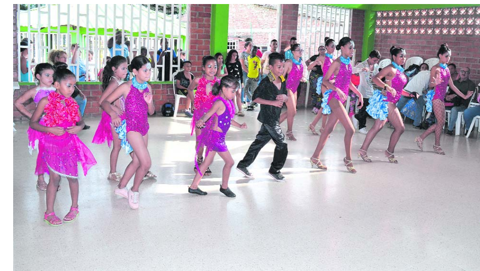
La salsa es un espacio para que los niños y jóvenes desarrollen su talento.

"Además de bailar he aprendido a respetar a las demás personas, a convivir en grupo" manifiesta la niña quien destaca lo mucho que ha aprendido con los colectivos.