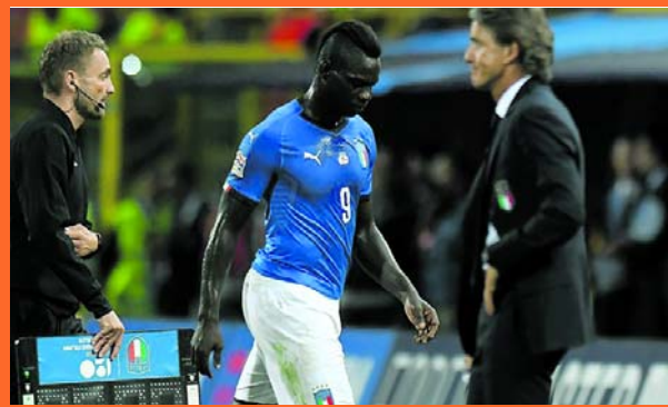
Mario Balotelli, deberá trabajar para ponerse en forma.

L'Équipe confesó que el integrante del plantel de Niza, retornó tras sus vacaciones con un llamativo peso de 100 kilos y con dos semanas de retraso respecto a sus compañeros. Tanto así, que el seleccionador Roberto Mancini se refirió a ese tema: "Su nivel físico es un problema en este momento, voy