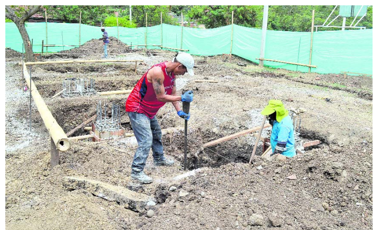
A buen ritmo avanzan los trabajos de construcción del salón recreativo multipropósito.

planteado como una necesidad, como espacios para los niños y jóvenes, como también los adultos mayores, tener una biblioteca, que haya un espacio para que la junta de acción comunal tenga oficina propia.