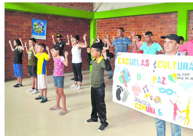
Los Colectivos Culturales de Paz es una apuesta para ocupar el tiempo libre de los menores de edad.