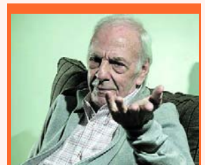
Cesar Luis Menotti

Si existe una palabra autorizada para hablar de la Selección Argentina, es el estratega Cesar Luis Menotti, quien se refirió a la postura del técnico Lionel Scaloni, con relación a retirar el número 10 de la albiceleste, hasta que Messi retorne: "No me parece bien que le guarden la 10 y no creo que a él le interese tanto. Para mí va a volver, pero no hay que traerlo".