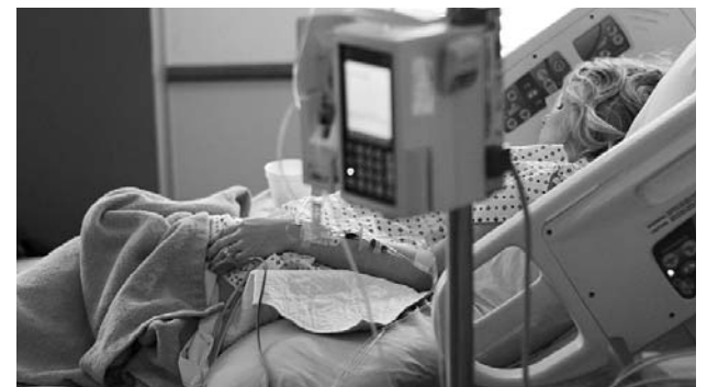
Los derechos de petición son de pacientes con cáncer para ser atendidos.

En lo que va corrido del 2018, en Cali 426 pacientes que sufren de algún tipo de cáncer se han visto en la obligación de realizar derechos de petición a sus EPS, pues no están recibiendo la atención de manera oportuna.