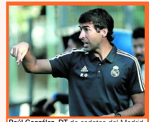
Raúl González, DT de cadetes del Madrid

En relación con la dudosa continuidad del entrenador Julen Lopetegui con Real Madrid, inició el carrusel de apellidos que suenan en el entorno 'merengue' para sustituirlo. El entrenador italiano, Maurizio Sarri, actualmente en Chelsea y que antes tuvo un gran paso por Napoli en la Serie A, es de los nombres que más ruido hacen en Madrid. Asimismo, el actual director técnico de la selección de Alemania, Joachim Löw, es otro de los candidatos a suceder al ex técnico de la selección española.