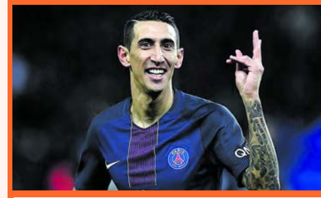
Angel Di María, del PSG.

Por otra parte, suena también el técnico argentino Mauricio Pochettino, quien anteriormente había sido vinculado con la Casa Blanca. Por último, una de las posibilidades también es la de encontrar la solución dentro de casa y ascender al histórico goleador Raúl González, quien hoy dirige a los Cadetes del club de Madrid.