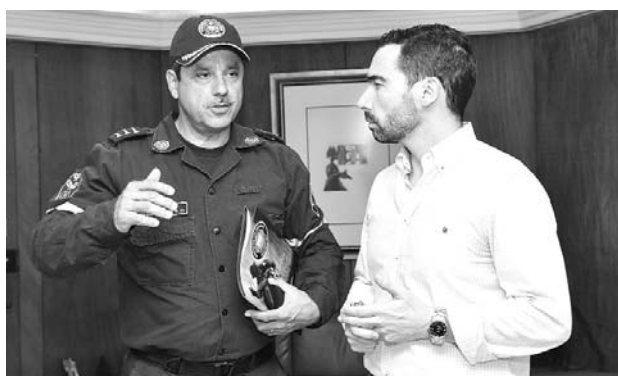
Las tres partes aseguraron que se sentarán a concertar.

Después de una reunión celebrada por el Secretario de Seguridad, el Comandante de los Bomberos de Cali y el Alcalde de la ciudad, se determinó que el presupuesto que año tras año se le otorga al cuerpo bomberil, no se verá afectado y que los montos de dinero que se destinan a las diferentes entidades serán determinados mediante mesas de concertación.