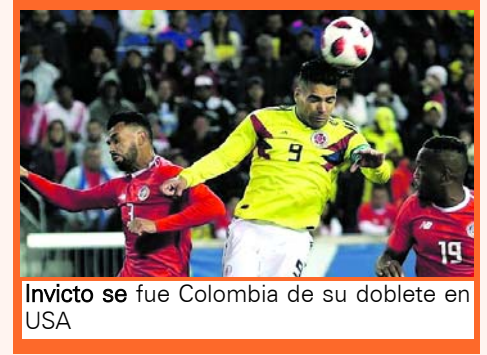
Invicto se fue Colombia de su doblete en USA

Exitoso doblete amistoso para Colombia Dos victorias, 7 goles a favor y 3 en contra, es el balance estadístico que dejó el doblete