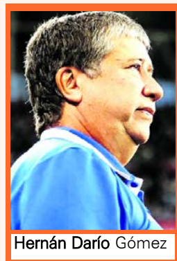
Hernán Darío Gómez

Con un pálido empate sin goles ante su similar de Omán, la Selección de Ecuador que dirige el colombiano, Hernán 'Bolillo' Gómez, cerró su segunda gira post-Mundial. En el duelo que se jugó en Doha, Qatar, 'Bolillo' utilizó un plantel renovado y plagado de caras nuevas. Recordando que el pasado viernes, Ecuador había caído ante la selección local por 4-3. Este es el cuarto encuentro para Hernán Darío Gómez, desde su vuelta a el 'TRI'. En su re debut venció 2-0 a Jamaica y luego 2-0 a Guatemala, sumándole estos últimos dos resultados, el balance se compone de dos victorias, un empate y una derrota.