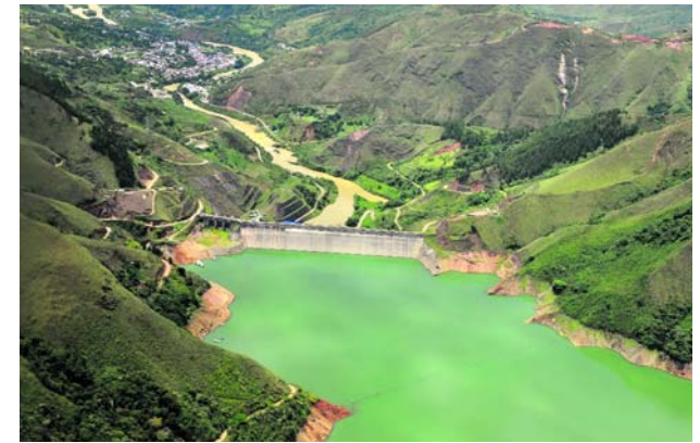
El servicio de transporte en la represa de Salvajina fue suspendido.

La compañía también suspendió las actividades de mejoras e intervenciones viales en diferentes veredas del área de influencia de la central hidroeléctrica, como también de los proyectos ambientales y sociales en el territorio debido a la presencia de estos grupos armados ilegales que operan en la zona.