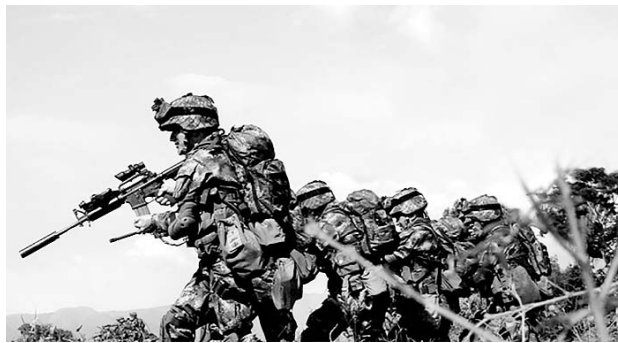
El Ejército continúa la búsqueda de alias "Guacho" en el sur del país.