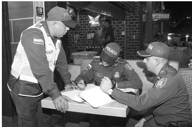
Se hizo un llamado a la ciudadanía para que denuncien cualquier tipo de delito.

homicidio se llevarán a cabo en el oriente de Cali, los atracos a mano armada en la zona céntrica de la ciudad y la venta de narcóticos, en los parques del casco urbano.