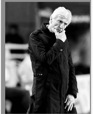
José Néstor Pékerman

El reconocido equipo Argentinos Juniors del fútbol, tenía como principal sueño contratar a José Néstor Pékerman como sucesor de Alfredo Bertí en la conducción técnica del 'Bicho', pero, el ex seleccionador Tricolor, desestimó la propuesta y ahora todos la órbita se enfoca en Jorge Almirón y Pablo Lavallén.