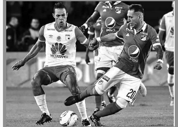
El ganador de esta serie, enfrentará al triunfador de Deportivo Cali vs. Liga de Quito

El duelo de vuelta se disputará el 2 de octubre con localía para el elenco embajador. El ganador de esta serie, encarará los Cuartos de Final contra el ganador de la llave compuesta por Deportivo Cali y Liga Universitaria de Quito, serie que va ganando