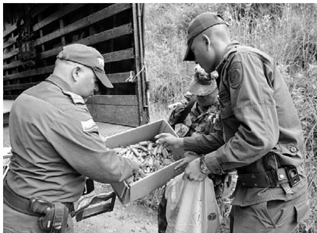
La manipulación de pólvora ha dejado a la fecha 40 personas quemadas en el Valle.