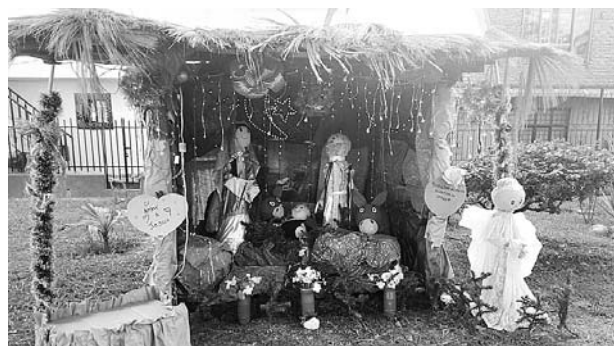
Especial Diario Occidente

Y la CVC premió a los pesebres ecológicos que participaron en el concurso convocado por la entidad.