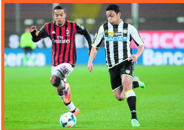
Luis Muriel jugando para Udinese contra Milan

Todo indica la inminente salida del Sevilla del