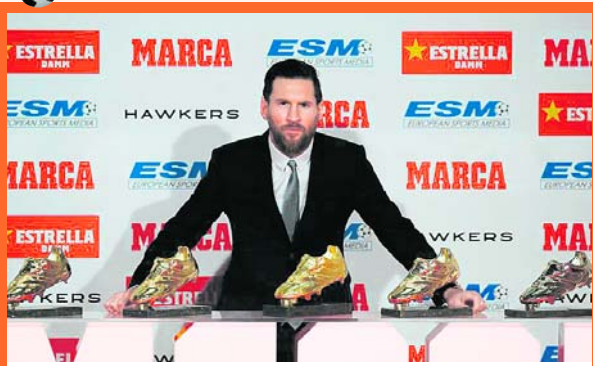
Lionel Messi y sus cinco Botas de Oro

El astro argentino, Lionel Messi, abrazó la Bota de Oro de esta temporada, quinta en su cuenta personal, al ser el máximo goleador de las ligas europeas. En la premiación, la 'Pulga' reconoció la labor fundamental para este logro, del trabajo de sus compañeros blaugranas.