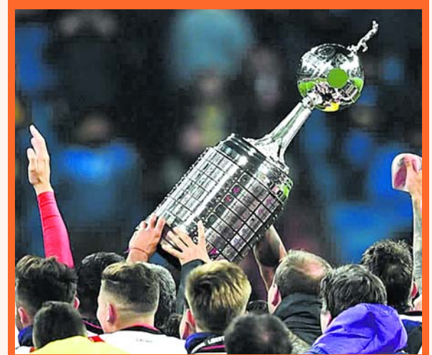
Nuevos premios para el próximo campeón