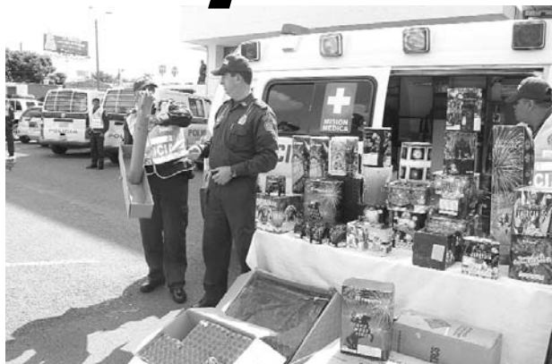
Recuerde que la pólvora se debe manipular por expertos.

Desde la secretaría de Gestión del Riesgo se viene trabajando en temas pedagógicos, tanto para padres y niños: "Lo primero que debemos hacer es no satanizar la