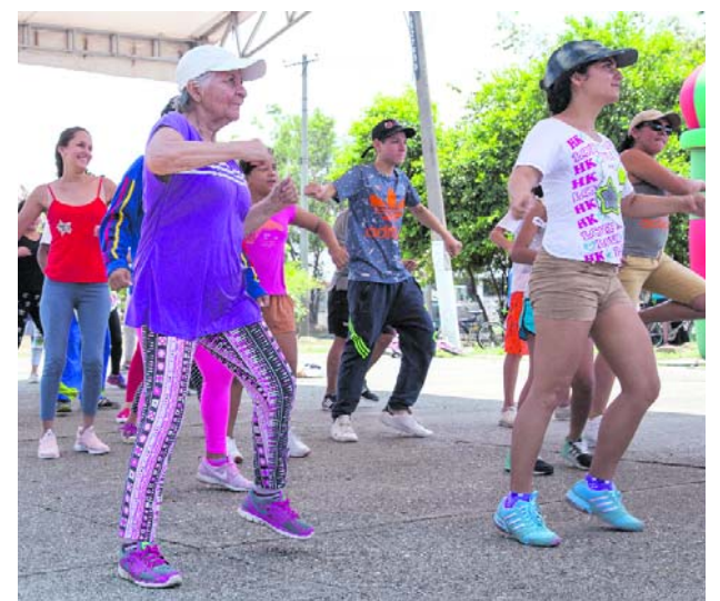
En la Ciclovía encuentras actividad física para todas las edades.