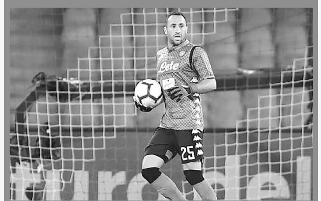
David Ospina sacó su arco en cero con Napoli

El debut del cancerbero colombiano, David Ospina, con Napoli en la nueva edición de la Champions League, se dio visitando a Estrella Roja en el estadio Rajko Mitic de Belgrado. Duelo que no pasó de una paridad sin goles, más allá del pleno dominio