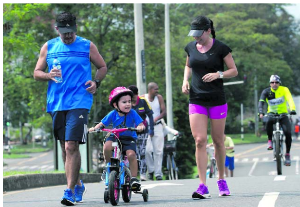
La Ciclovía es el espacio ideal para disfrutar en familia.

rrido de la Ciclovía central, iniciando desde el Metropolitano del Norte hasta la calle 16 con carrera 83, es decir el mismo recorrido dominical con dos modifi-