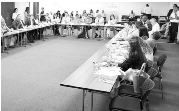
Los planes para el presupuesto son infraestructura, vías, tecnología, entre otros.

El presupuesto que se destinó al Valle del Cauca es de 2.08 billones de pesos, los congresistas aseguran que esta