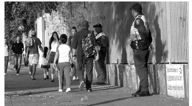
Intervendrán colegios que tengan cerca parques.

Con una visita por parte del Secretario de Seguridad y Justicia y el Alcalde de Cali al colegio Santa Librada, se dio inicio al plan de coque contra delitos de alto impacto en la ciudad.