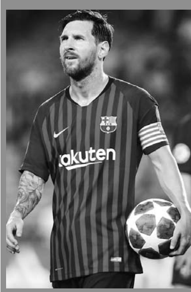
Nuevo triplete para Messi

Más allá del pletórico triplete que abrazó el crack Lionel Messi en el triunfo 'Culé' 4-0 recibiendo a PSV por la Champions League, con el que sumó desde el 2004, 103 goles en 125 encuentros (0,80 goles por partido) en este certamen, existe un record que tiene en la mira 'La Pulga', ya que todavía está lejos de Cristiano Ronaldo en esta estadística. Desde la edición 2002/2003, 120 tantos acumula el astro portugués en la máxima competición europea. Cifra obtenida disputando 156 partidos (0,78 goles por partido).