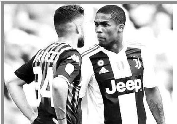
El brasileño Douglas Costa, fue sancionado

Cuatro partidos de suspensión deberá pagar el extremo brasileño Douglas Costa, al servicio de Juventus. Sanción impuesta por el juez deportivo de la Serie A italiana, generada por escupir al italiano Federico Di Francesco, en el encuentro del pasado domingo contra Sassuolo, ganado