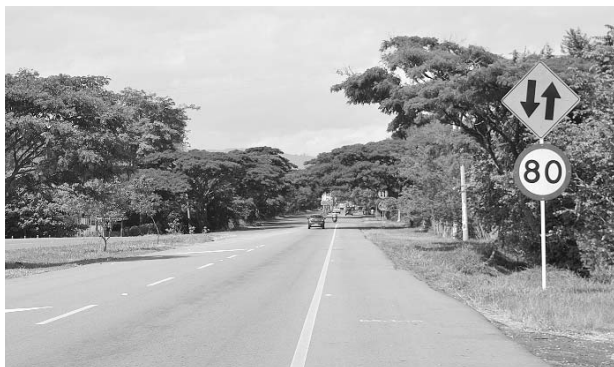
La vía Santander de Quilichao-Popayán tendrá doble calzada.

Se indicó en el foro que todavía existen inquietudes