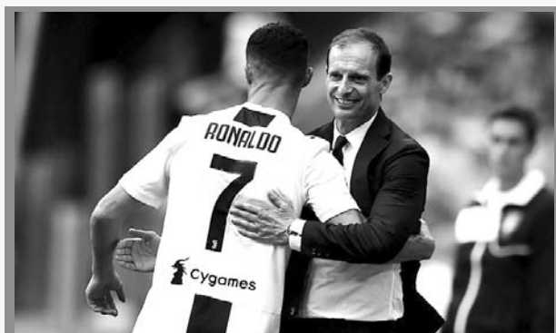
Massimiliano Allegri, habló de CR7

Allegri: "Llegó el mejor jugador del mundo a la Juve"