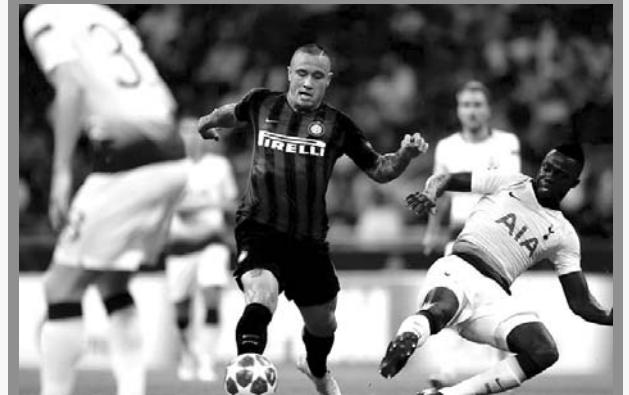
Tottenham, perdió 2/1 en su visita a Inter de Milan

Daba la sensación de que Tottenham, equipo en el que juega