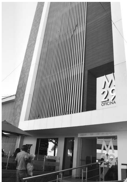
Este es el edificio donde sucedieron los hechos.

Algunos concejales de Cali propusieron que este tipo de aparatos (ascensores, escaleras eléctricas, rampas) fueran revisados en toda la ciudad, precisamente