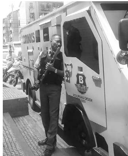
Dos guardas de seguridad fueron asesinados.

La Alcaldía anunció que el mes de octubre del 2018, fue el mes de menos asesinatos en los últimos 16 años, un total de 75 homicidios en 31 días, un promedio de 2,4 muertes violentas al día. La com-