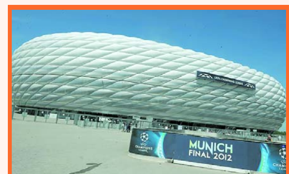
el Allianz Arena de Bayern Múnich

Bayern Múnich con su estadio el Allianz Arena, anunció su candidatura para acoger por cuarta vez en su historia, ya que lleva dos veces en el viejo Estadio Olímpico y una vez en la Allianz Arena, la final de la Champions League de la versión 2021. Premisa a la que deberá competir con la ciudad rusa de San Petersburgo.