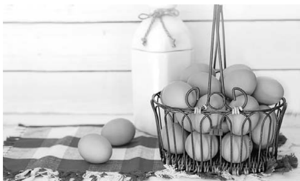
Hay preocupación por el incremento de los precios en los productos de la canasta familiar.

El dirigente gremial manifestó que "encarecer el precio del huevo, el arroz, el pollo, la