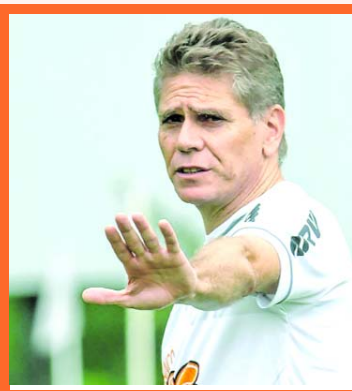
Paulo Autuori, DT brasileño.

El experimentado estratega cuenta con un historial de 27 equipos dirigidos, dos ellos selecciones nacionales (Perú y Catar). En su país natal estuvo al frente de Sao Paulo, Gremio y Cruzeiro. Su logro más destacado fue la Copa Libertadores del 2005 con Sao Paulo.