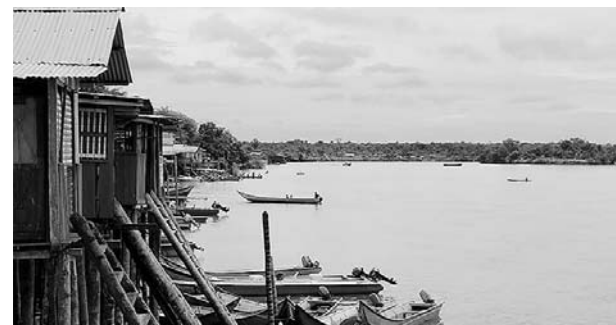
Especial Diario Occidente

La comunidad de Guapi rechazó el ataque a la menor por parte de su padrastro.