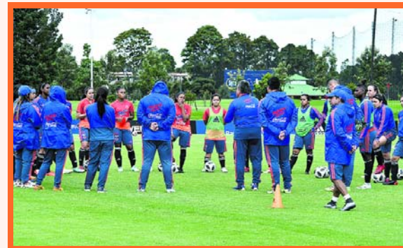
Selección Colombia Femenina Sub-17

Este jueves antes del entrenamiento, dos jugadoras y el técnico atendieron a la prensa: