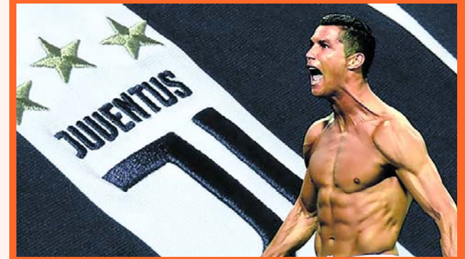
Cristiano Ronaldo, delantero de Juventus

El crack brasileño Neymar y el astro argentino, Lio Messi, obtienen 513.000 y 427.000 euros por publicación, respectivamente. El gales Gareth Bale (158.000 euros), Zlatan Ibrahimovic (150.000 euros) y Luis Suárez (128.000 euros), completan el listado.