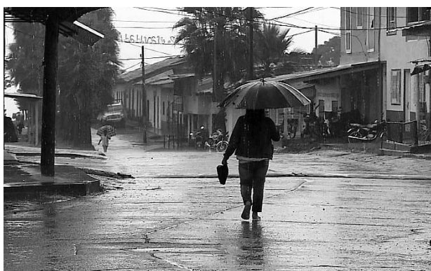
La CVC recomendó tomar medidas ante la llegada de la temporada de lluvias.

Por eso la corporación ambiental envió una circular