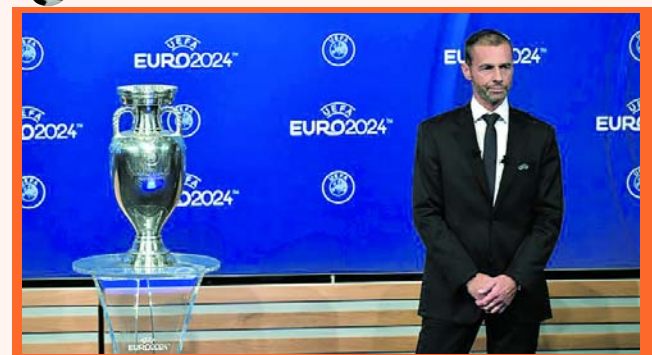
Alemania será la sede de la Euro 2024

El Comité Ejecutivo de la UEFA decidió que Alemania organizará la Eurocopa 2024 durante la votación de este jueves en Nyon (Suiza), en la que el proyecto alemán se impuso al presentado por Turquía.