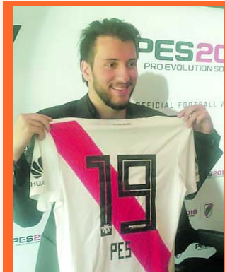
Nuevo vínculo para River

El equipo argentino, River Plate, luego de haber estrenado el logo de PES en su camiseta en el último Superclásico, presentó de manera formal su más reciente convenio con la empresa Konami, que estará ligada al elenco Millonario por los próximos tres años. La última versión del Superclásico, fue el debut del logo del popular videojuego de fútbol, que estará en la camiseta de River por las próximas tres temporadas, sumándole a 'La Banda', un buen ingreso adicional.