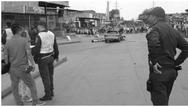
Se espera que el índice de muertes siga bajando.

Para el subsecretario de Seguridad, Pablo Uribe, esta es una noticia reconfortante, pues mediante planes de choque, se están salvando vidas. "Las estrategias interinstitucionales de la Alcaldía con los entes de seguridad, están dando frutos. Ahora el reto es presionar para poder llegar a cero