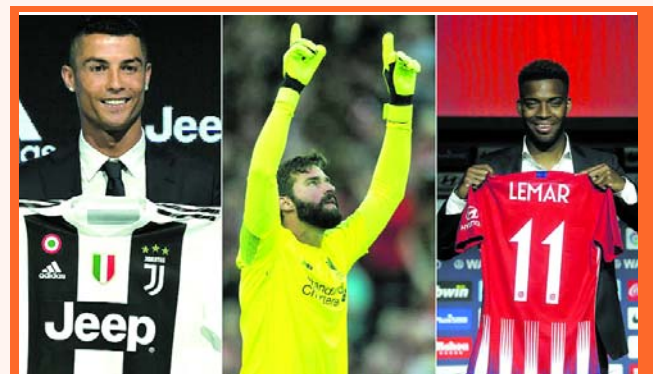
Los gastos de transferencia alcanzaron los 4.2 billones de dólares

Este ligero aumento fue impulsado por las ligas de España e Italia, mientras que las de Inglaterra, Francia y Alemania experimenta-