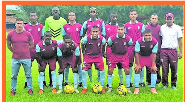
El club Deportivo Aston Villa

El club Deportivo Aston Villa, ubicado en el corregimiento de Villa Gorgona Candelaria, esta de cumpleaños. En la celebración de los 15 años, que tendrá diversas actividades recreativas y protocolarias, fueron invitados, dirigentes, entrenadores, medios de comunicación y personas del fútbol del Valle del Cauca.