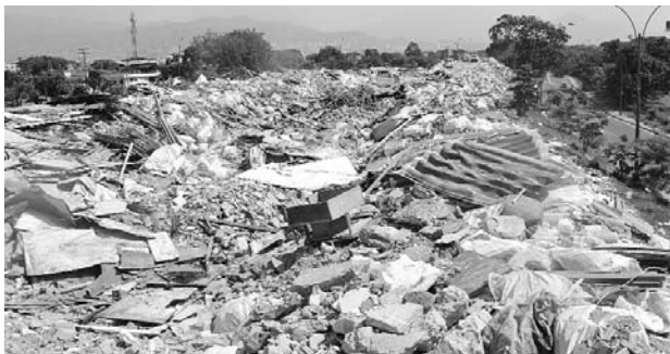
Este es el panorama que se vive en la escombrera de la 50

Con un plan de descolmatación y aprovechamiento de los escombros, la Unidad Administrativa Especial de Servicios Públicos Municipales de Cali (Uaespm) busca poner fin al vertedero de residuos de construcción de la carrera 50 con autopista Simón Bolívar. Las autoridades esper-