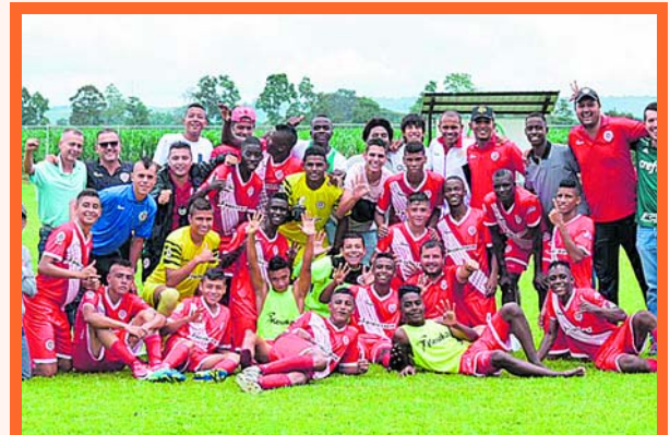
Equipo sub-15 del Cortuluá

En su primer año en esta categoría el equipo 'Corazón' del Valle llegó a la final de campeonato nacional organiza-