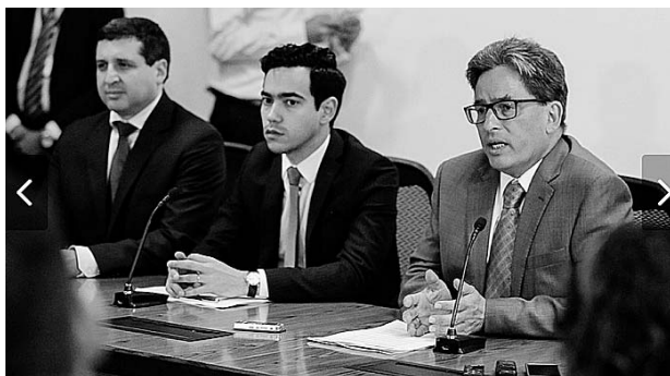
La Ley de Financiamiento aprobó un paquete de nuevos impuestos anunció en rueda de prensa el Ministro de Hacienda Alberto Carrasquilla.

Otro de los impuestos aprobados es la sobretasa al sector financiero en el que este sector pagará cuatro puntos por encima de las demás empresas, quedando