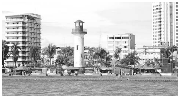
La alcaldía de Buenaventura solicitó al gobierno más inversión para el distrito.

En carta abierta, 750 organizaciones religiosas y laicas,