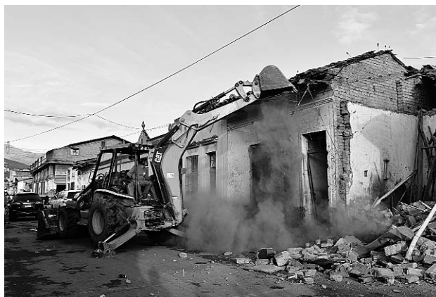
En este lugar se vendían de 5 mil a 9 mil dosis de droga cada día.

del búnker de la Fiscalía, edificios residenciales y comercios.