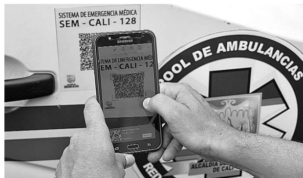
Así sería el proceso de caracterización de las ambulancias en Cali.

La Secretaría de Salud de Cali, ente encargado de la vigilancia de las ambulancias en la ciudad, lanzó una estrategia para que los agentes de tránsito y policías puedan constatar, mediante el escaneo de un código, el cual está pegado como calcomanía en el carro, si el vehículo se está dirigiendo a atender una emergencia o no, así como permisos, papeleos, entre otros.