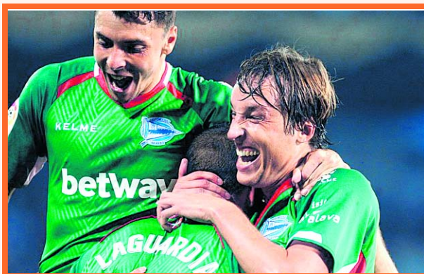
Alaves da la sorpresa en España

En la apertura de la novena jornada de la Liga de España, el Deportivo Alavés venció por la mínima diferencia en su visita a Celta de Vigo. Victoria que lo ubica a un punto de diferencia de Sevilla, en la privilegiada cima de la tabla de posiciones.