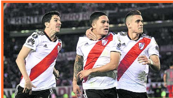
Colombianos presentes en River

River Plate tiene sus cañones totalmente apuntados hacia el duelo del próximo martes ante Gremio, válido por la ida de las semifinales de la Copa Libertadores. Y desde ya, el entrenador Marcelo Gallardo tiene todo decidido.