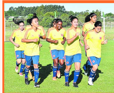
Las chicas de la Selección Colombia Sub 17

"He estado muy cerca de anotar, ojalá ante Corea la suerte me acompañe... Para poder lograr el objetivo debemos estar muy seguros atrás, y eso es lo que yo espero brindarle a mi equipo el próximo miércoles".