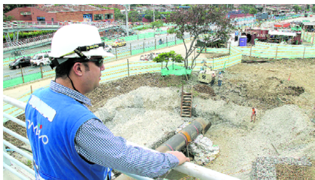
Estas importantes obras darán una mano en la movilidad de la ciudad.

del Cauca habló sobre esta importante reunión, la cual definió el futuro de varias obras vitales para Cali y el departamento: "La reunión que se hizo con Ángela María Orozco hace ocho días que estuve allá en Bogotá y con algunos de la bancada parlamentaria dio buenos resultados, al inicio no se iba a hacer