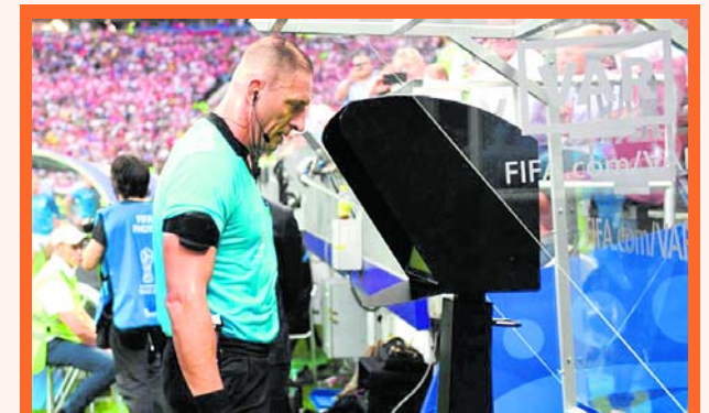
El VAR estará en la Copa América Brasil 2019, en la Copa Libertadores y la Sudamericana.