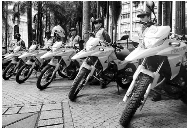
Al grupo de uniformados se suman también agentes de tránsito.

El comandante de la Policía de Cali, brigadier general Hugo Casas, comentó cómo se gestó este plan de seguridad para comer-