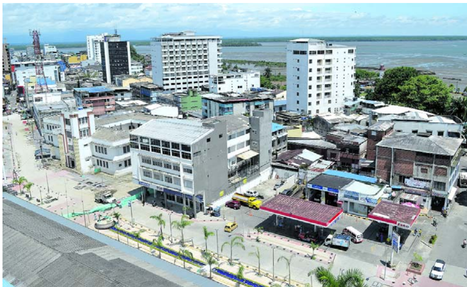
El corredor Buga- Buenaventura debe ser una de las prioridades del gobierno nacional enfatizó la CCI.

Culminó en Cartagena el XV congreso nacional de Infraestructura.