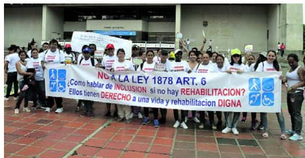
Con pancartas, los familiares de los menores marcharon en contra de este recorte

La ley 1878, apoyada desde la alta dirección del ICBF, recortó el recurso económico a