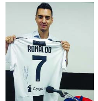
- ¿Qué dice Ventana de la "subasta show" de camisetas de famosos en Cali?...Lea.