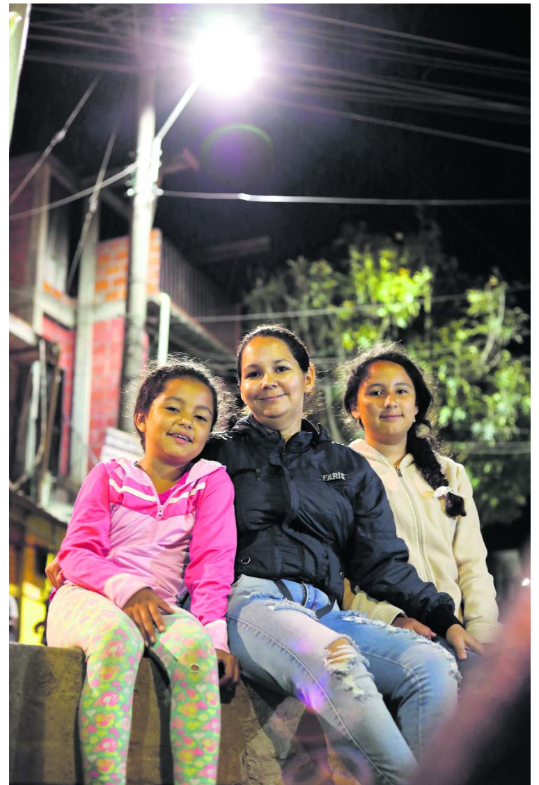
Cali Brilla con entornos más seguros para todos

público no solo es cambiar las luces amarillas por luces blancas, significa que una Cali mejor iluminada es una ciudad en la que los niños pueden salir con tranquilidad a los parques, en la que los jóvenes puedan hacer deporte