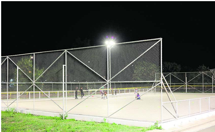
Más espacios visibles para la recreación y el deporte