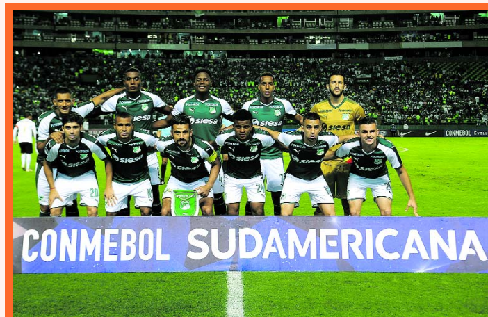
Finalizando el mes de octubre, Deportivo Cali volverá a disputar la Copa Sudamericana.

Cuartos Final de la Sudamericana que podría ser el martes o miércoles siguiente.