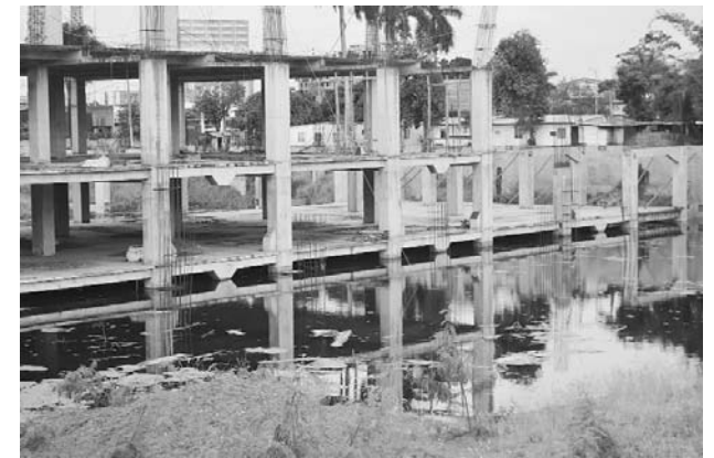
Este es el predio en el que se realizó la siembra de peces.

En el segundo puesto del ranking de delitos se encuentran los informáticos, es decir suplantación de identidad, clonación de tarjetas, robo de información personal, pornografía infantil, entre otros. "Los delitos informáticos son los segundos que más azotan al Valle y a Cali", aseguró el vocero de la Fiscalía.