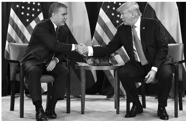
Especial Diario Occidente

Por su parte, el Vicepresidente de Estados Unidos Mike Pence dijo que Estados Unidos "va a entregar 48 millones de