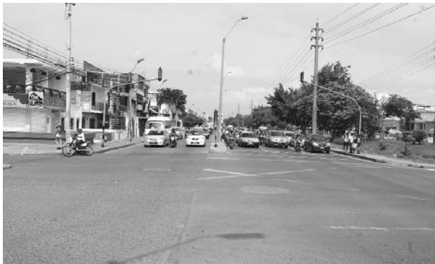
Uno de los sitios en los que más roban en Cali es la autopista suroriental con calle 52

En lo que va corrido del año, la ciudad ha presentado un aumento del 40% en las denuncias de delitos con respecto al 2017. Este incremento, según la Fiscalía, se debe al proceso de mejoramiento en cuanto a agilidad en las denuncias. El crimen más denunciado es el hurto.