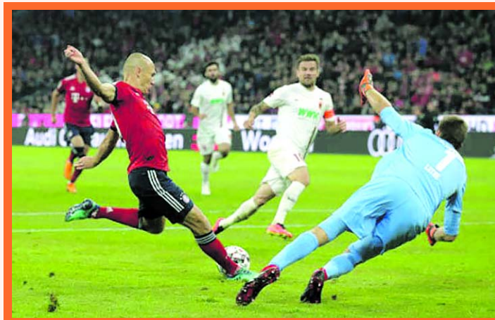
Bayern Múnich sin James Rodríguez, empató de local a un gol

En un dato no menor, Bayern Múnich perdió sus primeros puntos de la actual Bundesliga, gracias a la paridad a un gol que tuvo recibiendo a un Augsburg que jugó un encuentro de gran intensidad. El cuadro 'Bávaro' por su parte, apostó por las rotaciones en su plantel.