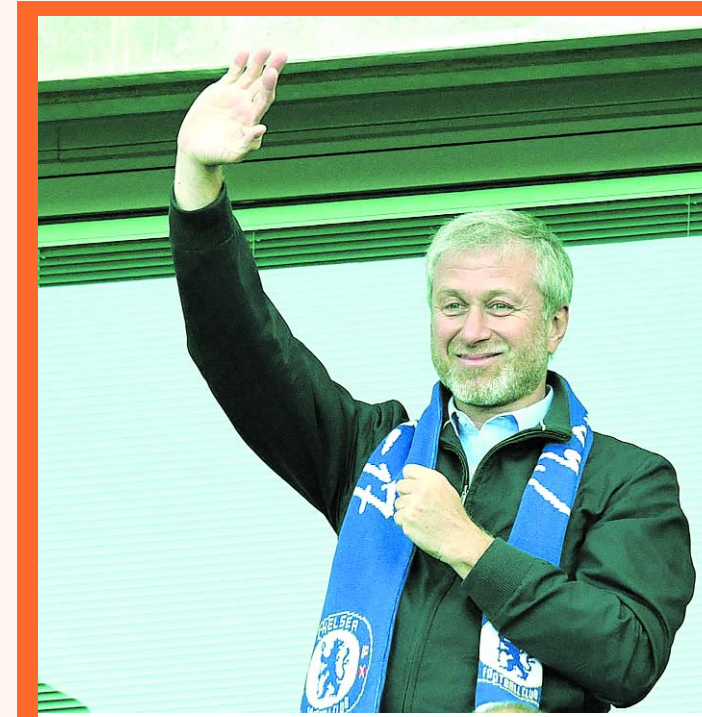
El magnate ruso, Roma Abramovich, dueño del Chelsea.

Roman Abramovich, magnate ruso quien compró al Chelsea en el año 2003 a cambio de 156 millones de euros, puso a la venta sus acciones con el equipo de Londres.