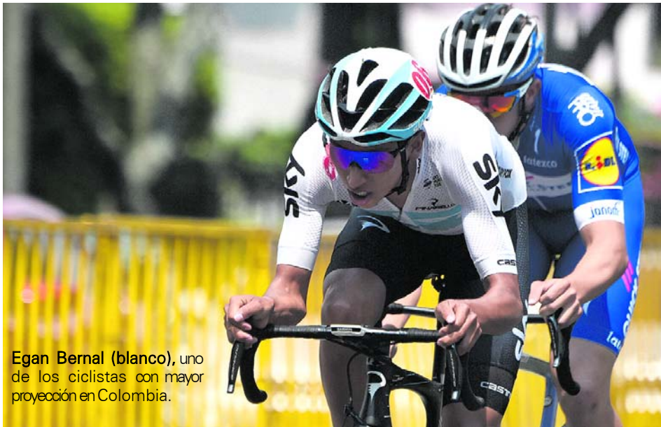
Egan Bernal (blanco), uno de los ciclistas con mayor proyección en Colombia.