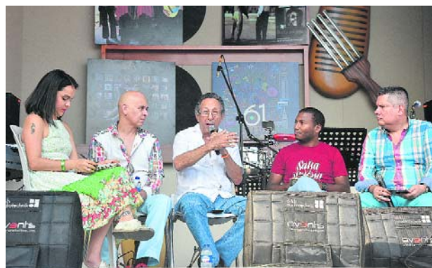
Hay un lugar para los foros y conversatorios.