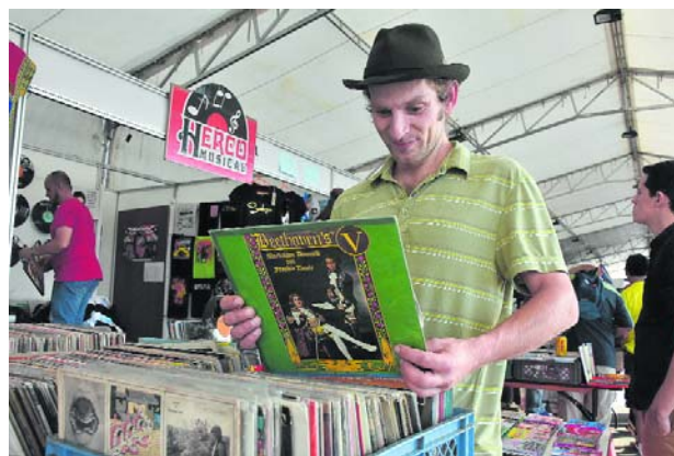
Existe espacio para la compra y venta de discos.

Desde ayer y hasta el 30 del mismo mes, se llevará a cabo en las Canchas Panamericanas el encuentro de Melómanos y Coleccionistas, un evento gratuito para los amantes de las raíces de la salsa y de la salsa misma. En este encuentro los melómanos y coleccionistas de salsa, exhiben con orgullo sus discos e instrumentos musicales. Las personas también podrán asistir al encuentro para comprar ropa, discos, instrumentos musicales y escuchar la salsa, esa que hizo grande y reconocida mundialmente a Cali.