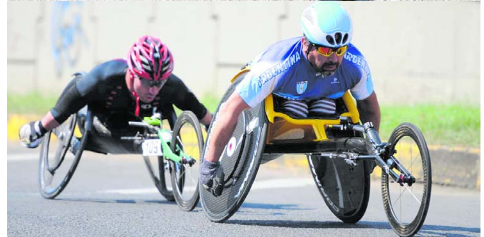
A ritmo de las ruedas: el Grand Prix enamoró a los asistentes.