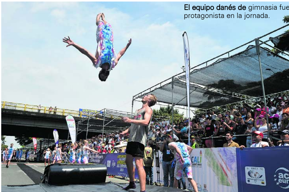
El equipo danés de gimnasia fue protagonista en la jornada.