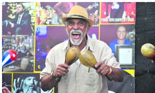
La vieja guardia se hace presente en el encuentro.