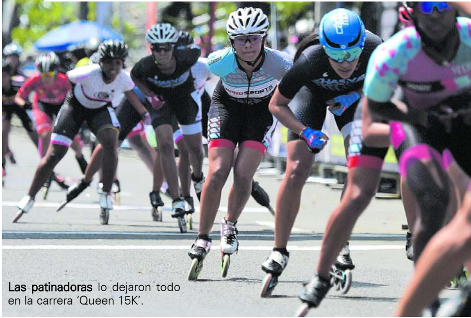
Las patinadoras lo dejaron todo en la carrera 'Queen 15K'.