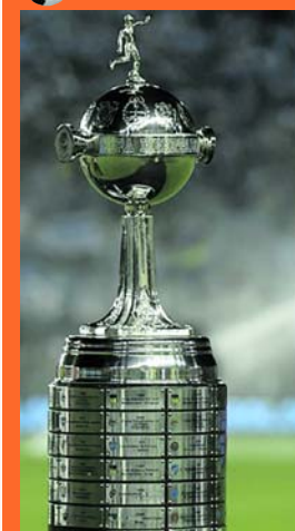
Se palpita la final de la Libertadores

Gremio - River y Palmeiras - Boca, disputarán sus duelos de vuelta de las semifinales de Copa Libertadores la próxima semana en Brasil. Compromisos en los que definirán los finalistas del más importante certamen de nuestro continente.