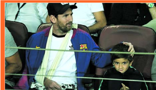
La Fundación de Messi da una mano en África

En esta zona no existía el hábito de servir la primer comida del día en el colegio. Este proyecto, que se ha implantado satis-