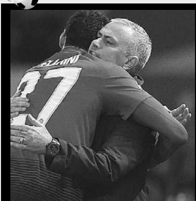
Marouane Fellaini celebra con Mou

Un triunfo por la mínima diferencia en cada uno de sus duelos, le otorgó a Juventus y Manchester United, el tiquete para los octavos de final de la Champions League tras vencer por 1-0 a Valencia y Young Boys, respectivamente.