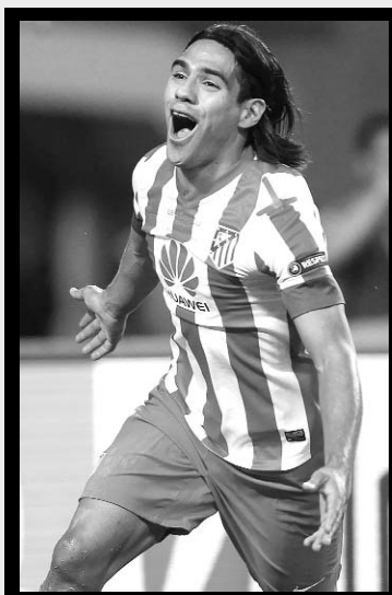
Radamel Falcao García

En uno de los primeros duelos de la jornada de la Champions League de hoy miércoles, el Atlético de Madrid que dirige Diego Pablo Simeone, recibirá a AS Mónaco de Radamel Falcao García. El colombiano, atacante y capitán del elenco monegasco, manifestó mucha emoción por enfrentar a su ex equipo.