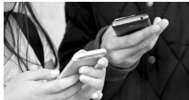
Autoridades recomiendan cuidar sus pertenencias personales en los buses y la calle.

Los cargos que serán impuestos por el ente rector son presuntos responsables de los delitos de concierto para delinquir, hurto agravado, y receptación y pedirá se