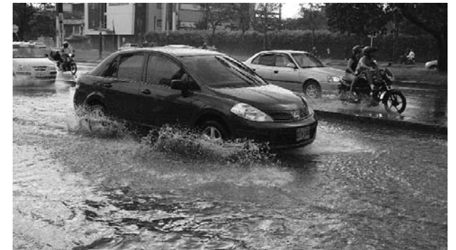
Esta es la segunda temporada de precipitaciones en el año.

riesgo de deslizamiento evite la acumulación de escombros, observe si existen grietas