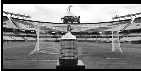
Barranquilla, Cali y Medellín, postuladas por la F.C.F.

En relación con la decisión de CONMEBOL de que la vuelta de la final de la Copa Libertadores entre River Plate y Boca Junior se dispute entre el 8 y 9 de diciembre fuera del territorio argentino, en un ofrecimiento formal, La Federación Colombiana de fútbol, propuso recibir y organizar este trascendental compromiso.