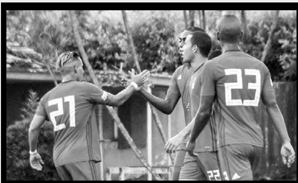
Avanzan las fuerzas básicas de América de Cali

El equipo categoría Sub 20B de América de Cali, consiguió su clasificación a los cuartos de final de la Copa Telepacífico, tras derrotar en el duelo de vuelta correspondiente a los octavos de final de este torneo contra Deportes Quindío, empatando a un gol en los 90 minutos, definiendo la serie a favor del elenco 'escarlata' desde el punto penal con un marcador de 5-3.