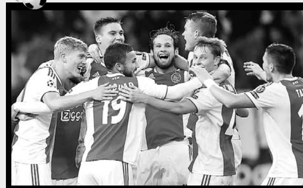
Ajax clasificó a los octavos de final.

Luego de trece años sin lograr abrazar esta ronda, el Ajax de Holanda selló su pase a los octavos de final de la Champions