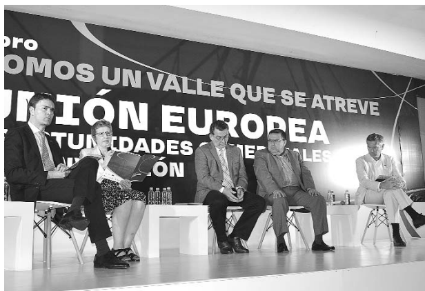
Varios de los representantes de la Unión Europea, debatiendo ideas en el foro.

Delegados de 14 naciones miembros de la Unión Europea, estuvieron en Cali para hablar sobre las inversiones que esta entidad internacional hará en el Valle del Cauca más exactamente en la capital y Buenaventura. La llegada de nuevas empresas y la inversión en educación, agricultura y pequeñas compañías, fueron los anuncios más importantes.