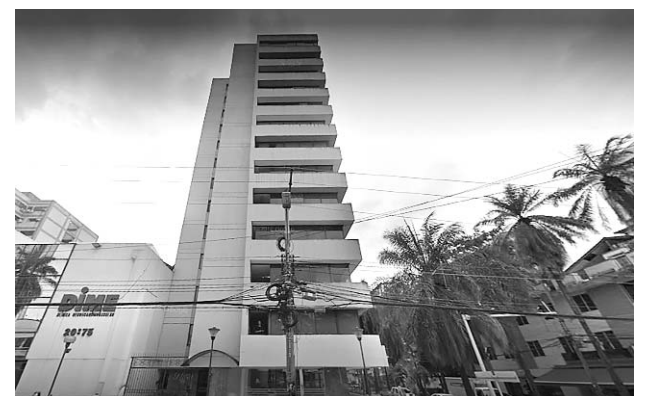
Este fue el edificio al que entraron los ladrones y robaron cerca de 180 millones de pesos.

Cuatro ladrones que aún no fueron identificados, lograron burlar la seguridad de un edificio, amordazar al guarda y robar una jugosa suma.