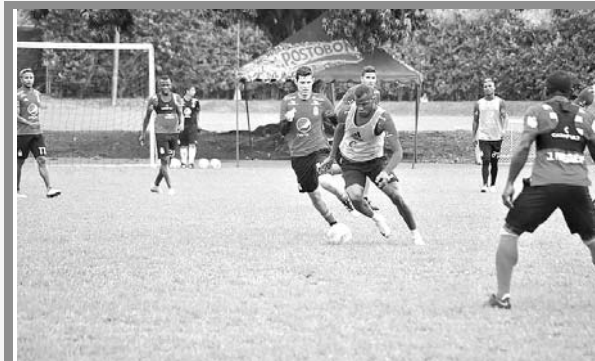
América de Cali se prepara para recibir a Huila.