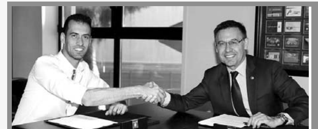
El internacional español, Sergio Busquets

Barcelona oficializó la renovación del centrocampista Sergio Busquets, hasta el 30 de junio del año 2023.