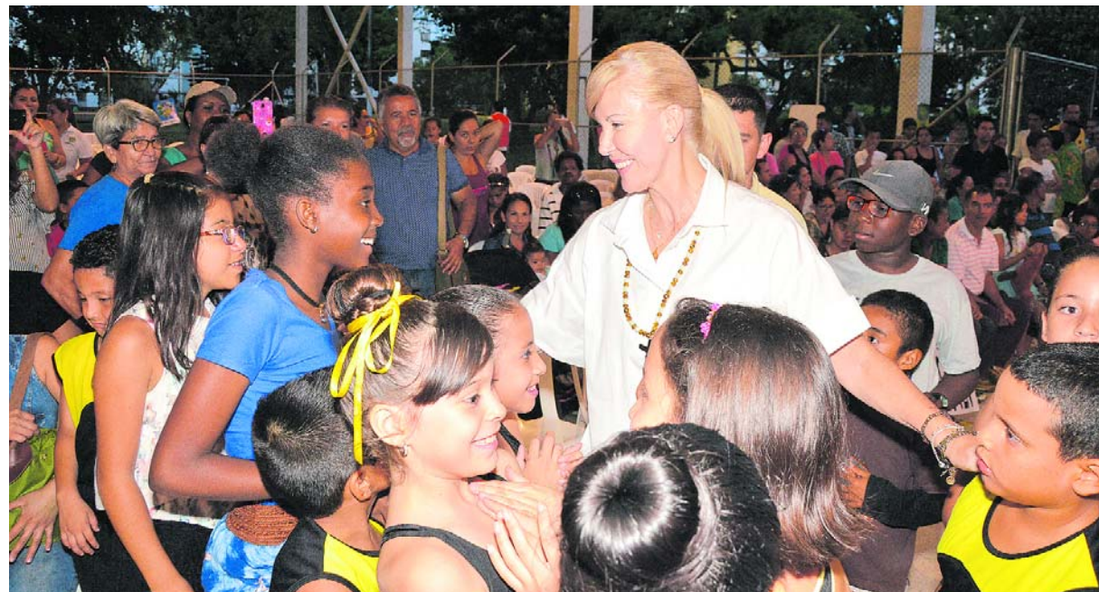
La gobernadora del Valle, Dilian Francisca Toro, escuchando a los menores durante su visita a la comuna 10.

Recuperar los parques, zonas verdes y espacios públicos hacen parte de los retos que se han trazado los líderes de la