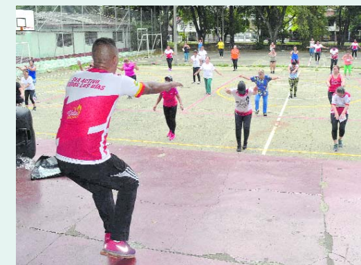
La aerorumba impulsa un estilo de vida saludable.

Un total de 37 grupos de adulto mayor existen en la comuna 10, de los cuáles 14 pertenecen a la Asociación de Adultos Mayores, los otros son independientes. Así lo expresa la directora de la