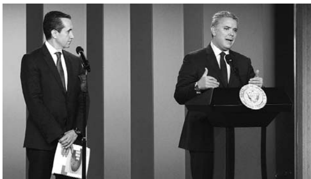
Especial Diario Occidente

Para atender la situación fiscal generada por esta situación, el Gobierno Nacional avanza en la elaboración de un documento Conpes que permitirá medir el