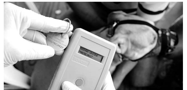
Comunidad alerta sobre problemas que traería este centro animal.

Vecinos de los barrios Cañaveral y Bella Suiza, aledaños al lote donde se construiría el Centro de Bienestar Animal, se oponen rotundamente a esta obra.