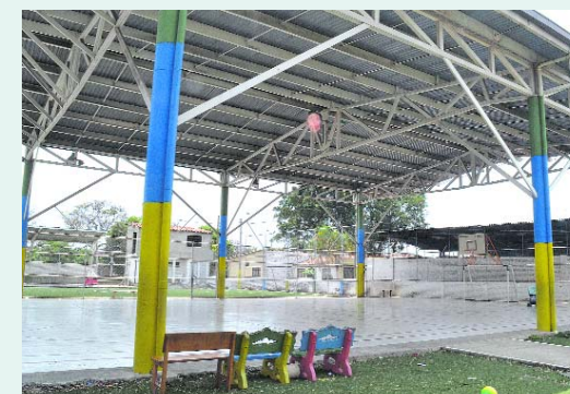
La comuna 10 tiene buenos escenarios deportivos.

"El proceso es deportivo pero va muy ligado a la parte integral del niño y la parte emocional para el acompañamiento y mejoramiento a través del deporte. Se trabaja solidaridad, com-