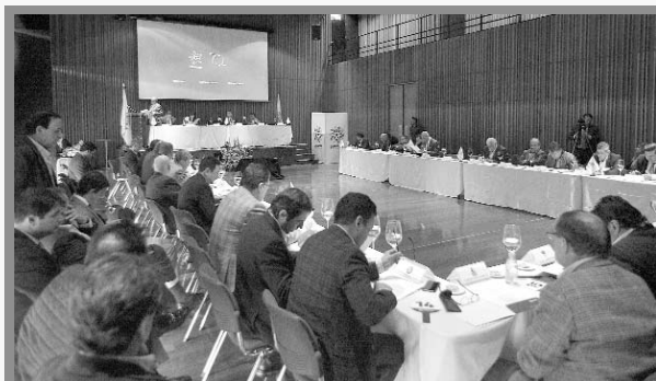
Asamblea de la DIMAYOR

La División Mayor del Fútbol Colombiano cumplió con su tercera Asamblea Extraordinaria del año 2018, con la representación de los 36 clubes afiliados a la entidad.