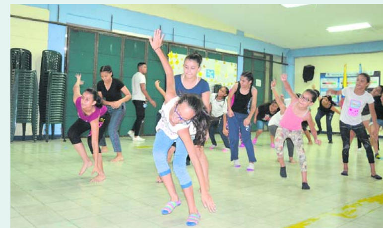
Con las Escuelas Culturales de Paz la niñez y juventud de la Comuna 10 aprende diversas manifestaciones artísticas.

de la comuna 10 como el colegio comunal Nueva Granada trabajan intensamente en las actividades de las Escuelas Culturales de Paz.