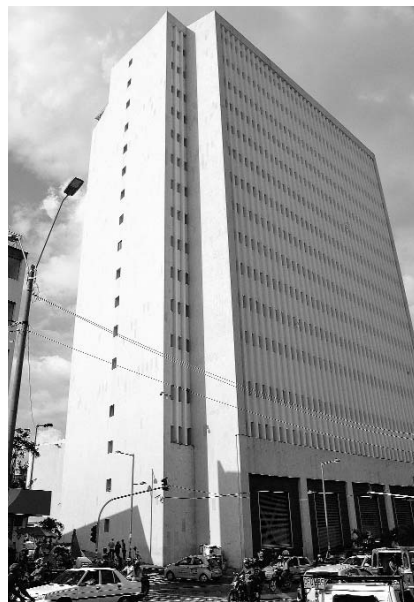
En el Palacio de Justicia quedaron funcionando los primeros cinco pisos.

Penal está funcionando a media marcha, desde el 25 de septiembre en los cinco primeros pisos del Palacio de Justicia. Si tiene que acudir a esta especialidad por algún motivo, ya sabe que debe ir a las torres A y B, de la habitual sede del recinto sobre la carrera 10 en el centro de Cali. Aquí están funcionando