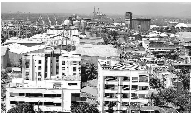
La muerte de una menor de once meses causó estupor en Buenaventura.

La niña, según se conoció fue trasladada de urgencias a una clínica de Buenaventura por su madre luego de presentar un cuadro agudo de dificultad respiratoria pero a