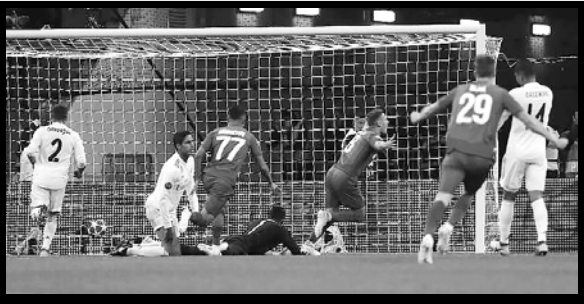
Perdió Real Madrid por la mínima en la Champions.