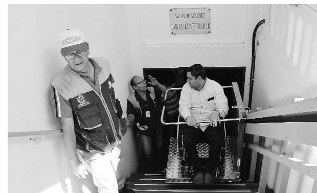
Especial Diario Occidente

Durante los hechos, un joven perdió la vida un joven, mientras que tres personas más entre ellas una mujer, resultaron con heridas.