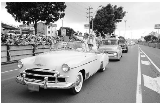
Los desfiles son el principal atractivo de esta festividad.

Otra novedad es el festival de mascotas, un espacio para