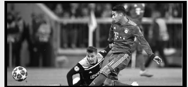
Continúa la mini crisis de Bayern Múnich.

Tres partidos sin ganar completó Bayern Múnich con su empate en condición de local 1-1 ante Ajax, en un duelo válido por la segunda jornada de la fase de grupos en la Liga de Campeones. Paridad que da la sensación incrementa la pequeña crisis que vive el elenco 'Bávaro', que había perdido el liderato en la Bundesliga tras encajar su primera derrota ante el Hertha y empatar ante el Augsburg.