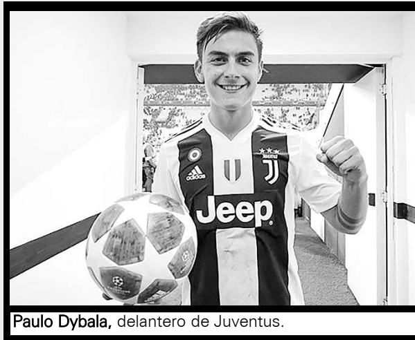
Paulo Dybala, delantero de Juventus.

Así, La 'Juve' se instaló como líder del Grupo H y en la próxima fecha, visitará al Manchester United en Inglaterra.