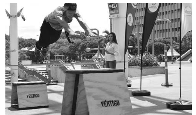
Vertigo es uno de los colectivos de deportes extremos que participará.

Cali está lista para recibir este próximo 27 y 28 de octubre, el Cali Sportfest, un evento deportivo que mezcla múltiples disciplinas en torno a la recreación y la vida sana.