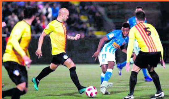
Atlético Madrid venció por la mínima diferencia al Sant Andreu de Barcelona

cuadro local pese a mostrarse muy inferior en el primer tiempo, recibiendo el gol de Gelson, tuvo opciones de empatar en los minutos finales. Fue triunfo 1-0 para el Atlético en la ida de los 16avos de final de la Copa del Rey.