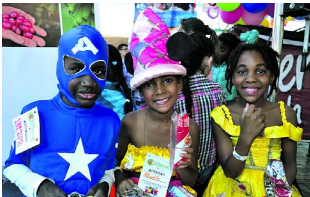
Las autoridades recomendaron denunciar anomalías a la línea 123 de la Policía.

Esta noche es una de las más esperadas por los niños para disfrazarse y salir a pedir los tradicionales dulces del "día de las brujitas", pero también de los delincuentes, quienes se aprovechan de cualquier situación para hacer daño. La Policía Metropolitana emitió una serie de recomendaciones, entre las que se encuentran no dejar salir a su niño solo, ni perderlo de vista.