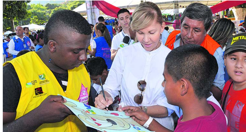
La gobernadora del Valle Dilia Francisca Toro comparte con los beneficiarios de las Escuelas Culturales de Paz en la comuna 14 de Cali.