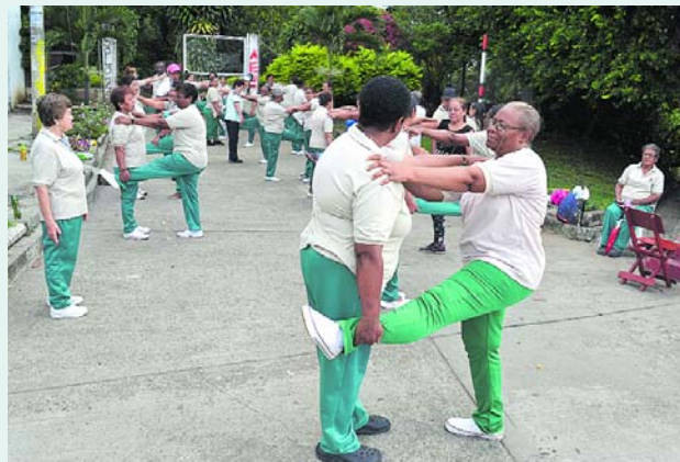
Grupos de la tercera edad como Los Pizamos han tenido el apoyo de la Gobernación del Valle e Inderval.

"Allí llegan jóvenes, adultos mayores, de todas las razas y edades, a practicar el deporte en una cancha múltiple durante tres días a la semana", dice. Las actividades las realizan al lado de la pista de patinaje los días martes y jueves en la noche en las que participan entre 180 o 200 personas, afirma Vargas, quien agrega que hay otros barrios de la comuna donde también se realiza aerorrumba.