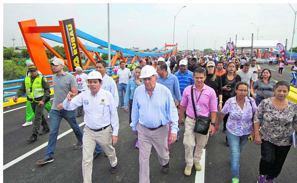
La prolongación de la Avenida Ciudad de Cali tuvo un costo de $56.000 millones y consta de 900 metros lineales de vía.

Cabe mencionar que el puente vehicular sobre el canal CVC Sur, uno de los desarrollos estructurales de esta prolongación de la Avenida Ciudad de Cali, es el más largo de la ciudad, pues su luz entre vigas de soporte es de 140 metros.