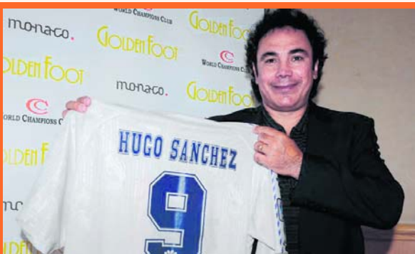
Hugo Sánchez quiere dirigir a los "merengues".

"Son pocos en el mundo que pueden estar enfrente de ese vestuario y le digo a Florentino Pérez que ya estoy listo. Si me llama, ya sabe dónde localizarme. Estoy capacitado y preparado para ello, pero si no, que sigan buscando y a ver si lo encuentran", aseguró Sánchez a ESPN.