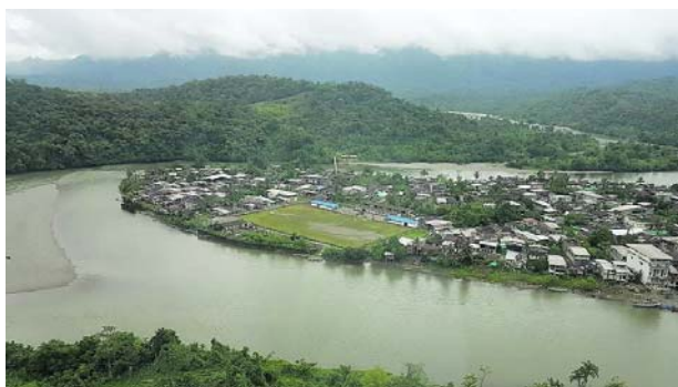
En López de Micay se presentaron seis homicidios que son investigados por las autoridades.