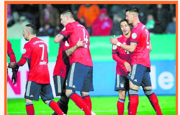
Bayern Munich avanzó a los octavos de final de la Copa de Alemania

En un duelo correspondiente a la fase previa a los octavos de final de la Copa de Alemania, Bayern Munich sin la presencia de James Rodríguez, logró clasificar al derrotar por 1-2 al Rödighausen, de la cuarta categoría.