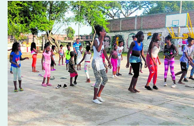
Niñas, niños y jóvenes de la comuna 14 se benefician de las actividades de las Escuelas Culturales de Paz.

En ese sentido el docente afirma que "a medida que va pasan-