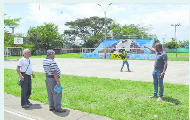
Una de las mayores inversiones de la Gobernación del Valle en la comuna 14 es la cubierta que se construirá en el Complejo Deportivo de Naranjos II.

brindarle una buena calidad de vida a nuestra comunidad, que se lo merece".