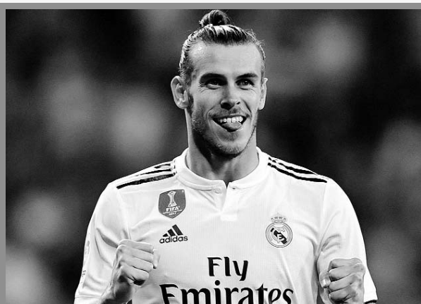
Retornará el delantero gales.

El atacante gales del Real Madrid, Gareth Bale, se recuperó de su lesión en el aductor generada en el derbi frente al Atlético de Madrid, y está listo para volver a la cancha. Tras llevar a cabo el último entrenamiento con normalidad, el entrenador Julen Lopetegui ratificó que cuenta con el jugador para visitar al Alavés este sábado en un encuentro