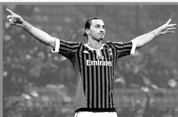
Zlatan Ibrahimovic podría volver al Milan

20 goles en 24 partidos a sus con Los Ángeles Galaxy de Estados Unidos, a sus 37 años de edad, es una clara señal de que Zlatan Ibrahimovic se encuentra lejos de su retiro.