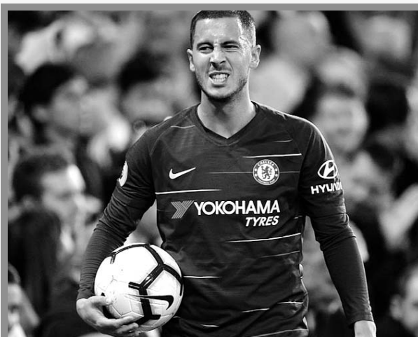
Hazard quizá no continúe en Chelsea

"En estos momentos estoy bien, pero en dos meses puede que sea diferente. Yo sigo entrenando en el campo y ya veremos lo que pasa. Si marco, está bien. Si no lo hago, pero juego bien, para mí es perfecto. Solo necesito seguir ganando partidos".