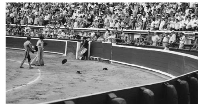
La temporada taurina de Cali irá del 26 al 31 de diciembre.