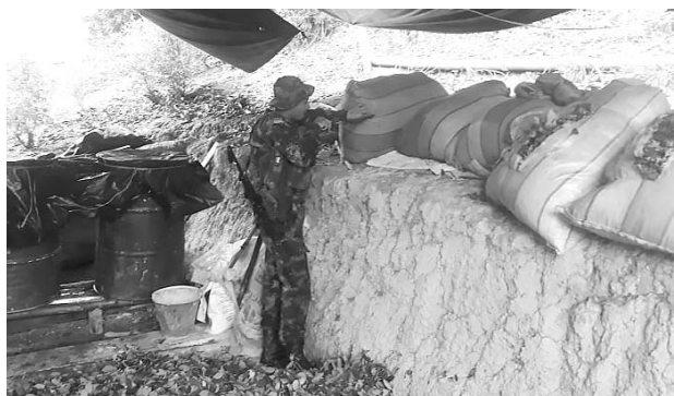
Especial Diario Occidente

Así mismo se ubicaron 7656 matas de amapola en zona rural del municipio de San Sebastián, donde soldados del Batallón de Alta Montaña 4 General Benjamín Herrera Cortés, mediante operativos y tras la denuncia de la ciudadanía, llegaron hasta este