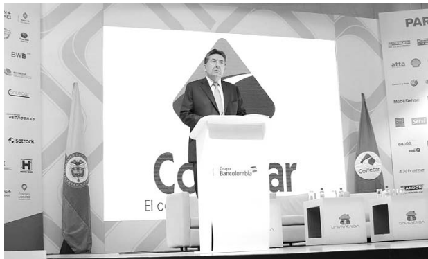
El fiscal Néstor Humberto Martínez, este viernes en Cartagena.

Fue capturado en Cartagena un turista que habría tenido relaciones con una menor de edad. Ante los hechos el fiscal general de la Nación, Nestor Humberto Martínez, dijo que se procederá con toda la rigurosidad de la ley para proteger la niñez del país. "El mensaje es muy claro, habíamos dicho que los turistas que incurrieran en estas conductas verían penas de 37 años y se están empezando a exponer porque ya hay el primer capturado", puntualizó Martínez. El Fiscal aseguró que el turista es procedente del centro del