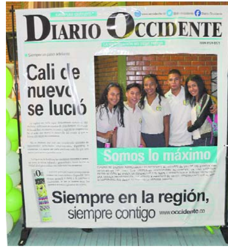
Los asistentes estuvieron literalmente en primera plana con este backing del Diario Occidente.