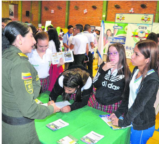
La Policía y las Fuerzas Militares también hicieron parte de la muestra de Expouniversidades.

Los estudiantes asistentes recibieron la Guía de Estudios del Diario Occidente, un completo directorio de universidades e institutos técnicos y tecnológicas, que contiene información detallada sobre las carreras que ofrecen las principales instituciones educativas de la región. Además, los jóvenes recibieron conferencias de orientación y motivación profesional y tuvieron la oportunidad de recorrer una muestra en la que 42 instituciones de educación superior les presentaron su oferta académica. En el evento también se hizo entrega de becas a algunos estudiantes.