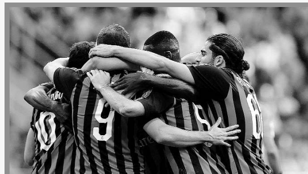
Cristian Zapata presente en la victoria del Milan

En un duelo válido por la octava fecha de la Serie A, en San Siro, Milan con el colombiano Cristian Zapata todo el partido con buen desempeño, y con doblete del argentino Gonzalo Higuaín, a los 27 y a los 34 minutos de la primera mitad, más un tanto del italiano Giacomo Bonaventura, a los 11 del complemento, derrotó 3-1 a Chievo Verona que descontó con gol de Sergio Pellissier, a los 18 minutos de la etapa final.