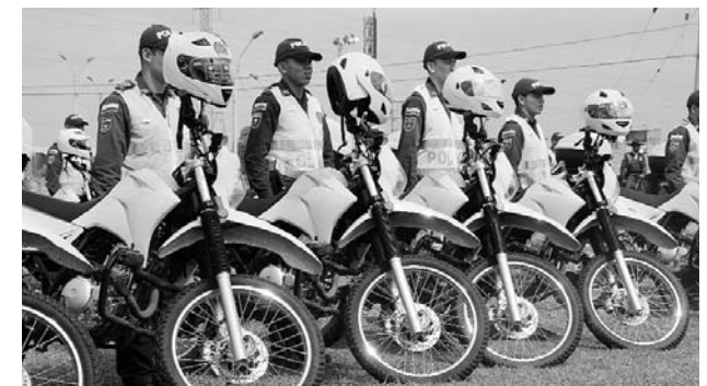
Gran parte del dinero será destinado a la Policía Metropolitana.