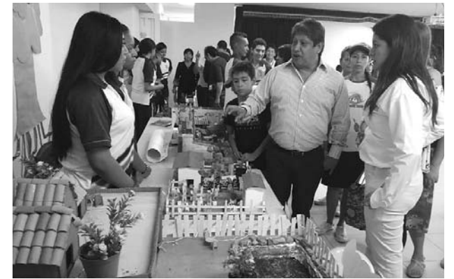
Especial Diario Occidente

La Alcaldía realizó un recorrido por estos sitios.