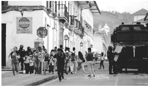
En el sector histórico de Popayán se presentaron enfrentamientos entre la fuerza pública y estudiantes.

Según manifestó el comandante de la Policía Metropolitana de Popayán, coronel