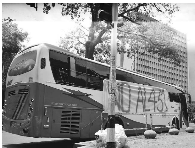
Los transportadores piden un plazo razonable para la chatarrización de sus vehículos.

En la mañana y tarde de ayer, varias movilizaciones tuvieron lugar en las calles de Cali. Maestros, estudiantes y transportadores protestaron por diversos motivos. Difentes zonas de la ciudad tuvieron congestiones vehiculares por largos periodos de tiempo. Hasta el cierre de esta edición no se conocieron reportes de alteraciones del orden público durante las manifestaciones.